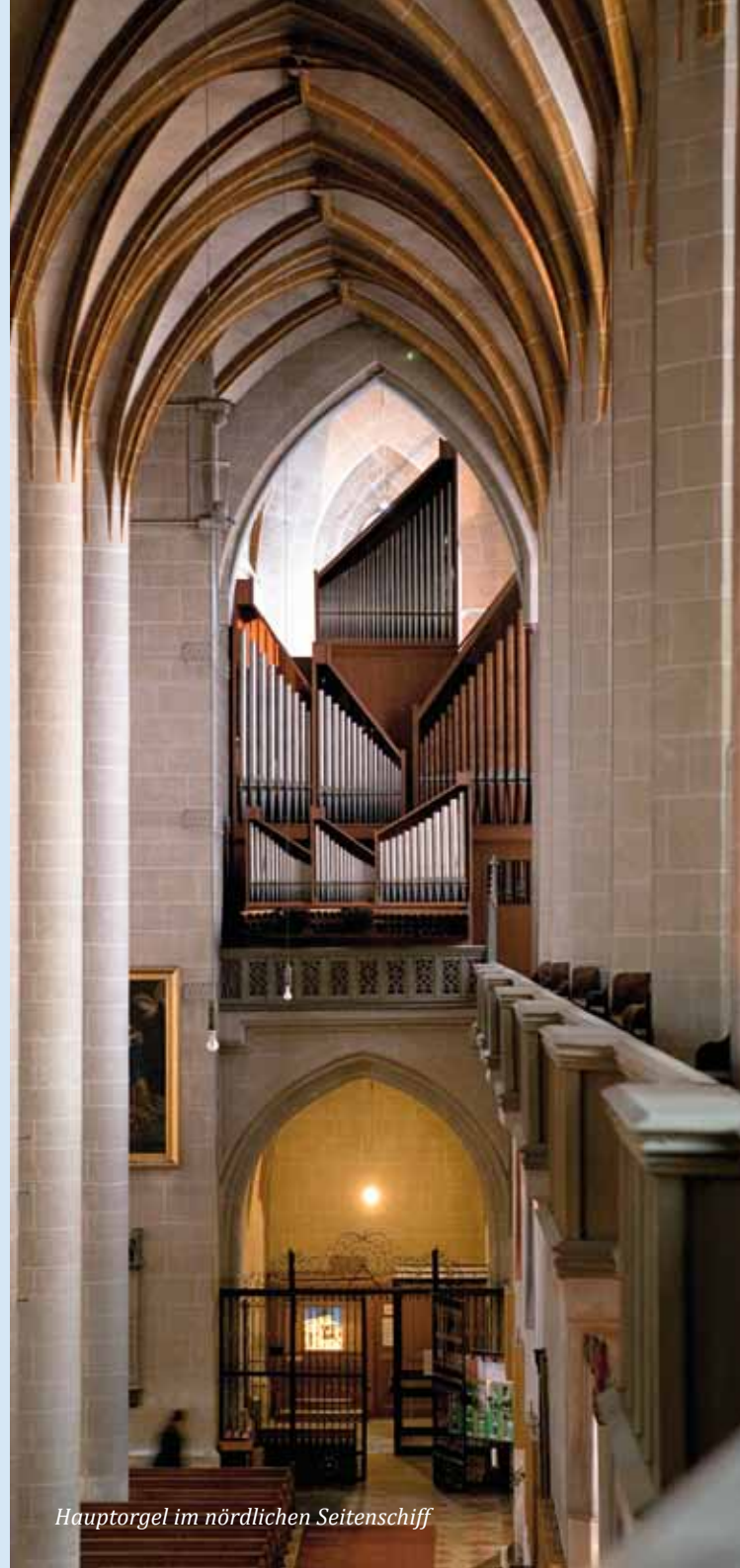
Hauptorgel im nördlichen Seitenschiff