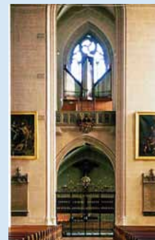
Schwellwerk im Hauptschiff

Sie können dem Verein mit beiliegendem Formular beitreten oder eine Spende zukommen lassen (per Überweisung oder beiliegender Einzugsermächtigung).